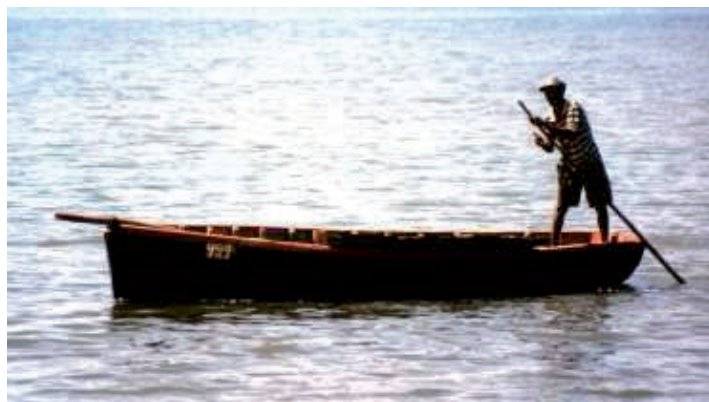
Lesen čoln na Mavriciju

skušala potisniti naprej. Rekel sem jima: » Pojdita z mano! « Toda rekla sta: » Ne, pretežki bi bili, ta fant te bo spravil do plaže. « Potem je mladenič s palico potiskal čoln proti obali.