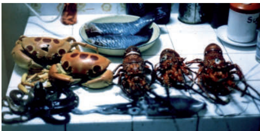
Tipičen ulov morskih sadežev

sprejeli so me v svoje življenje in me naučili nočnega potapljanja z zunanjih grebenov. To je neverjetno doživetje. Jastogi prihajajo ponoči, mi pa jih le oslepimo s podvodno svetilko in nato enostavno pobere- mo. Ribe ponoči spijo in odločiti se morate le, katero si želite in si jo privoščite za večerjo. To je bil krasen šport in svoj ulov smo lahko prodajali lokalnemu turističnemu hotelu.