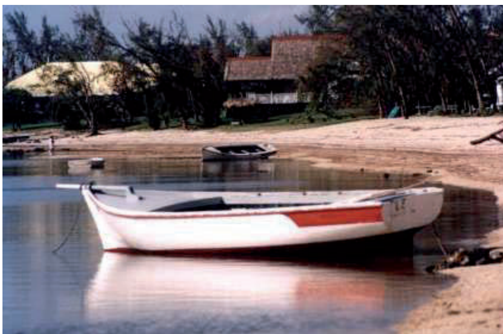
Obala Riviere Noire, kjer je pristal Ian po srečanju z meduzami

asfalt. Mladenič mi je skušal pomagati, a potem je spet začel kazati na morje, rekoč: »Moji bratje, moram jih poiskati.« Rekel sem: »Ne, ostani tukaj, da mi pomagaš.« Vedel sem, da lahko varno priplavajo, ker so meduze na zunanji strani greben. Toda odšel je, jaz pa sem sredi noči ostal sam ob cesti. Upanje me je zapuščalo in ulegel sem se, da bi malo počival.