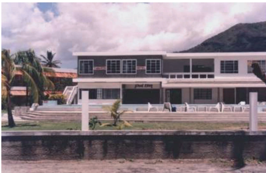
Hotel Tamarin Bay